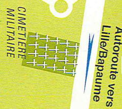
Autoroute vers Lille/Bapaume