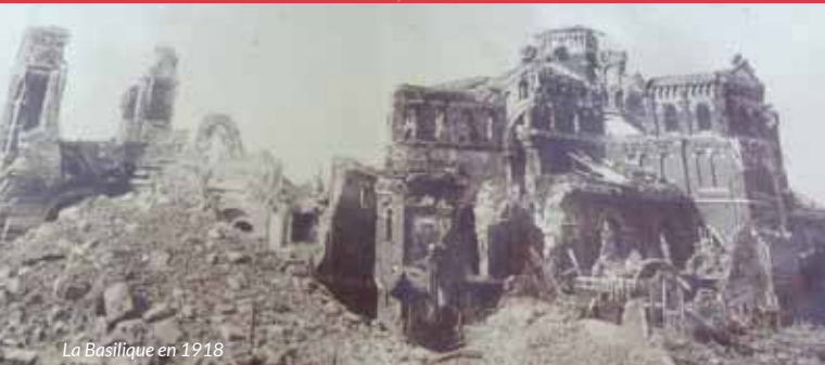
La Basilique en 1918

C'est une légende qui remonte au XI e siècle : un berger fait paître ses brebis à quelques centaines de mètres de la ville d'Albert. L'une d'elles s'éloigne du troupeau et s'attache à une touffe d'herbe malgré plusieurs tentatives d'appel du berger. Celui-ci s'approche et se met à la rudoyer sévèrement. Une voix venant du sol s'écrie alors : « Arrête, berger, tu me blesses ! ». Intrigué, le berger se met à creuser et découvre une statue de Notre-Dame, portant au front la trace du coup reçu. Très vite, le lieu fait l'objet d'une ardente vénération. Un sanctuaire est bâti à proximité et les cérémonies votives sont nombreuses. Après l'histoire de la brebis et la découverte de la statue, la Vierge d'Albert porte le nom de Notre-Dame de Brebières, et ce, dès 1138.