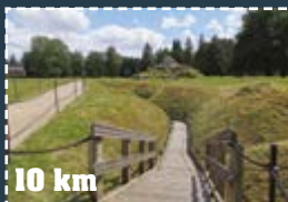
le Mémorial Franco-Britannique Thiepval Memorial of the missing